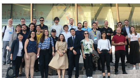
巴葡科創企業代表團參觀葡語國家食品展示中心 (2019年9月6日)