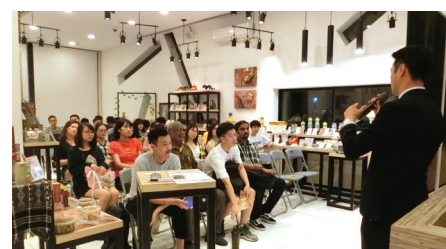
澳門城市大學葡語國家研究院的學生參觀葡語國家食品展示中心 (2019年9月27日)