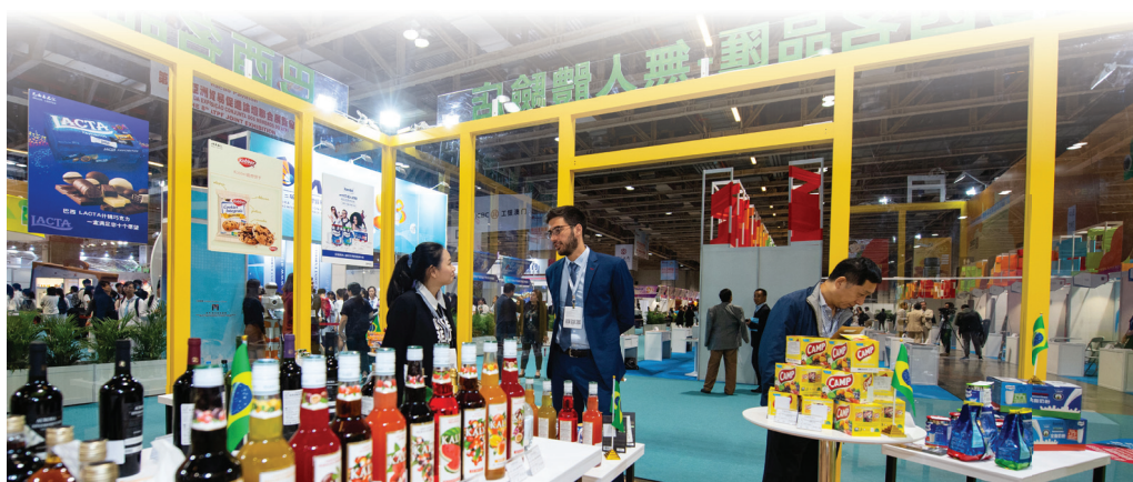
澳門貿促局協助葡語國家企業參加本地大型會展活動

在推進澳門「中國與葡語國家商貿合作服務平台」建設方面，相關的各項措施包括「三個中心」（即「中葡中小企業商貿服務中心」、「葡語國家食品集散中心」和「中葡經貿合作會展中心」）及「中國－葡語國家經貿合作及人才信息網」的構建，通過線上、線下一系列服務，向中國與葡語國家