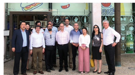
智利企業家中國橫琴行-澳門交流考察推介會與會者參觀葡語國家食品展示中心 (2019年8月28日)