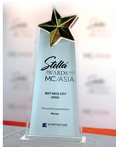
澳門獲頒發「最佳亞洲會議及展覽城市」獎項

本局自2016年起負責統籌及推動澳門會展業發展的工作，於去年亦獲得TTG亞洲主辦之「TTG 旅遊大獎頒獎禮」頒發「最佳會議及展覽局」獎項，並於今年與會展業界攜手合作成功競投2020年度「國際展覽業協會（UFI）亞太區會議」主辦權。