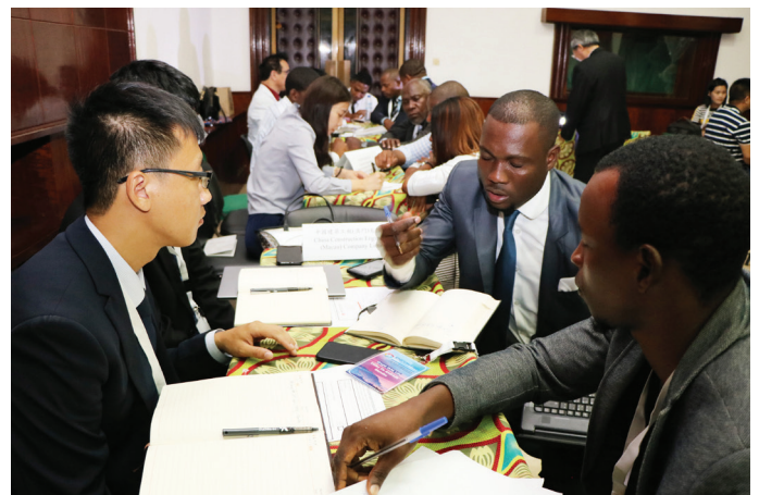
中葡平台助企業探商機

2019年2月，《粵港澳大灣區發展規劃綱要》正式頒佈，明確澳門中葡平台的功能，隨著“一帶一路”倡議的不斷推進，以香港、澳門、廣州、深圳作為中心城市的世界第四大灣區—粵港澳大灣區的建設工作有序开展，促進澳門與內地、“一帶一路”沿線國家以至葡語國家在經貿、金融、產能、人才培養等多個領域的合作，實現互利共贏。