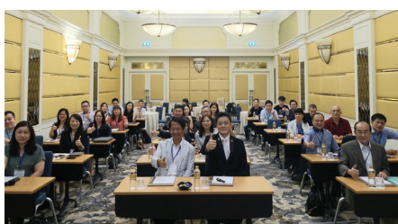
本局組織澳門企業代表赴泰國進行學習交流 (2019年9月23-26日)