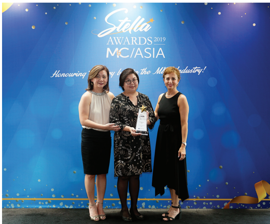
本局代表接受「最佳亞洲會議及展覽城市」獎項