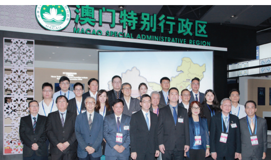
澳門企業家代表團於澳門館前合照

由廣東省貿促會主辦，廣東省商務廳、廣州市人民政府、中國對外貿易中心作為承辦單位的「2019廣東21