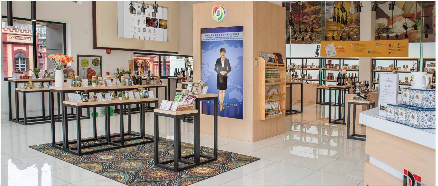
位於塔石玻璃屋的「葡語國家食品展示中心」展示來自8個葡語國家的飲品和食品

企業和投資者在開拓業務合作上提供支持。此外，在落實「中國－葡語國家經貿合作論壇（澳門）第五屆部長級會議」上的共識，積極配合中國與葡語國家合作十八項新舉措方面均取得了階段性進展，其中，「中國與葡語國家企業家聯合會」已完成在澳門註冊並有序开展工作、「中葡雙語人才培養基地」建設工作持續推進、以及「中國與葡語國家商貿合作服務平台綜合體」第一期預計可於2019年年底竣工，日後將為中國與葡語國家相關的政府組織、機構、團體提供會議場地、辦公場所、資訊中心等。